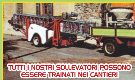
TUTTI I NOSTRI SOLLEVATORI POSSONO ESSERE TRAINATI NEI CANTIERI

La Cinomatic S.r.l. è certificata ISO 9001:2000 ICIM SISTEMA DI QUALITÀ